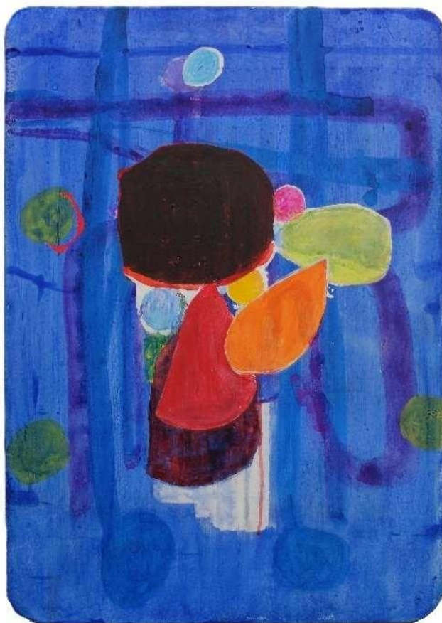
2024年 Session No.4 73.5x51.7 acrylic canvas panel