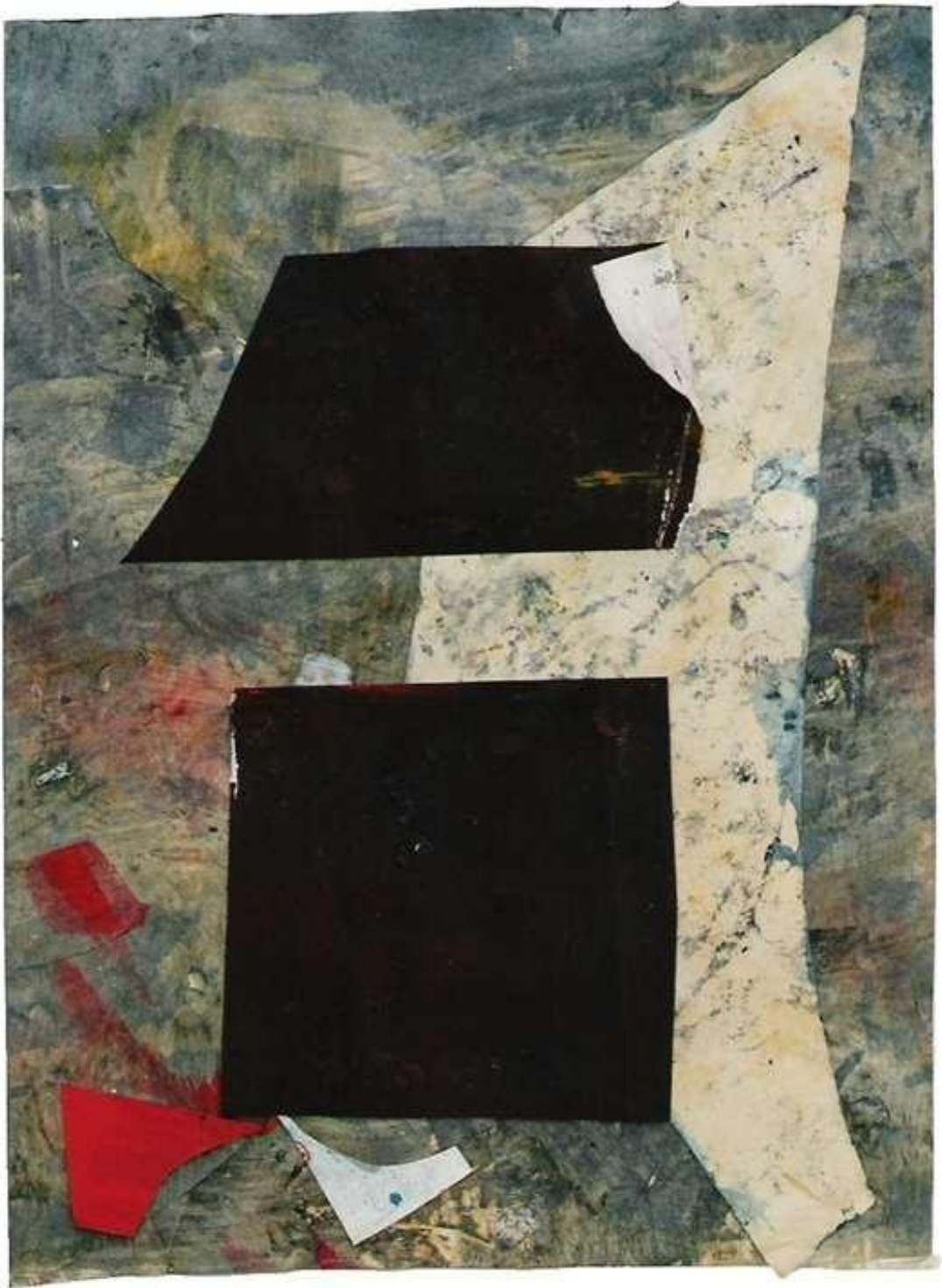
1 9 9 2 on the rock (石の上) 63cm×46cm ミクストメディア