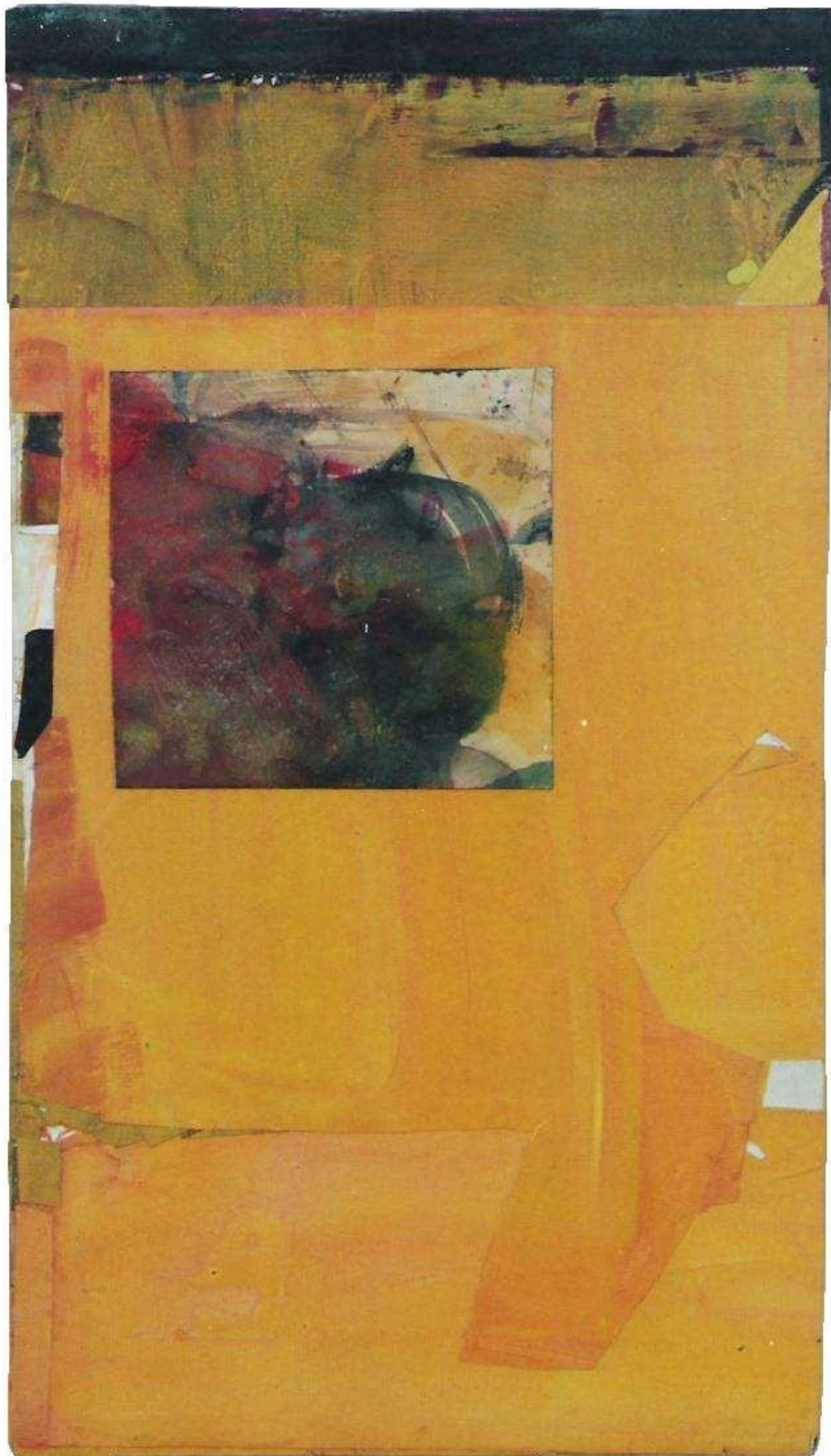
1994 Mirror (鏡) 75cmx56cm アクリル紙 ボード