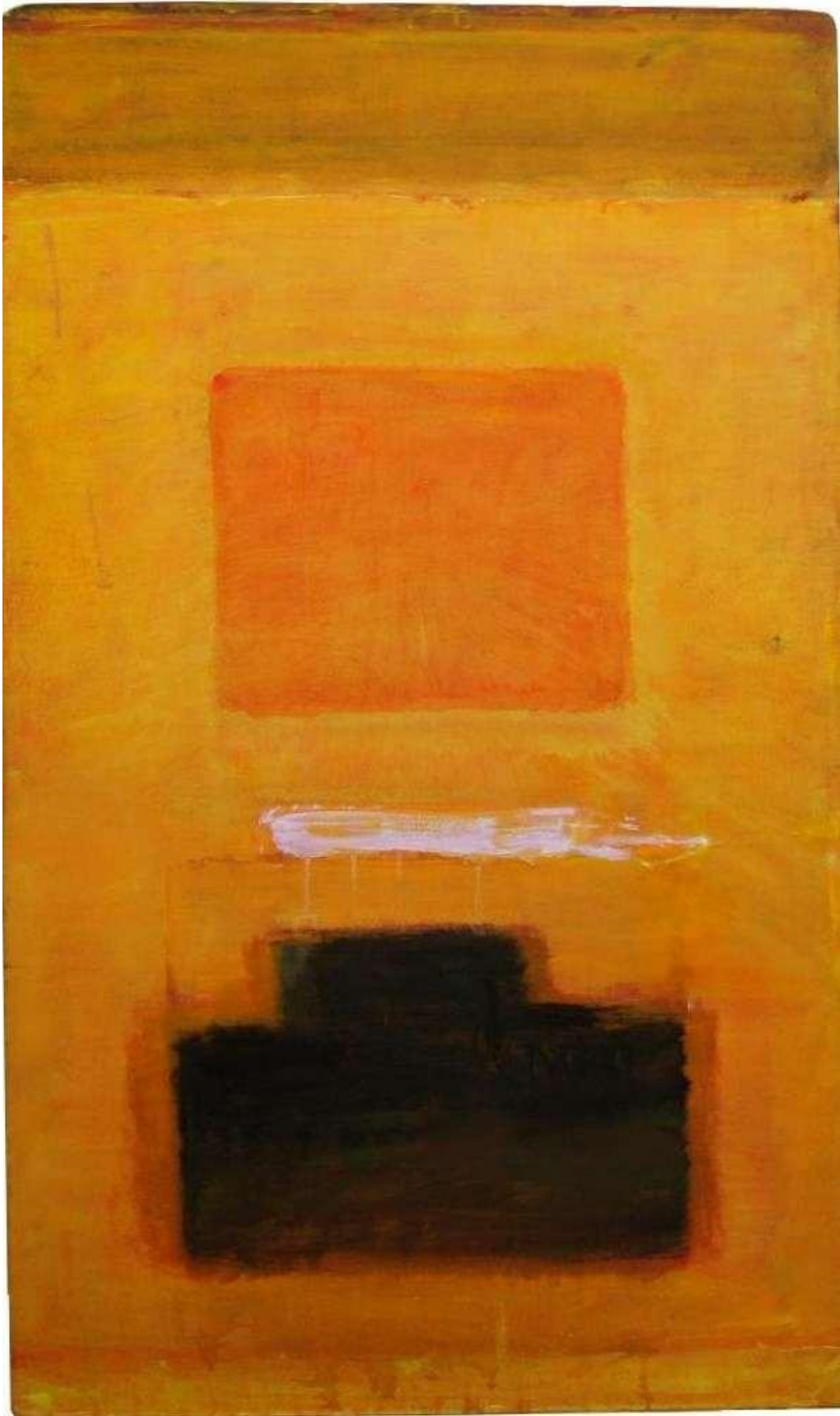
2003 y b 156cm×91cm キャンバスにアクリル パネル