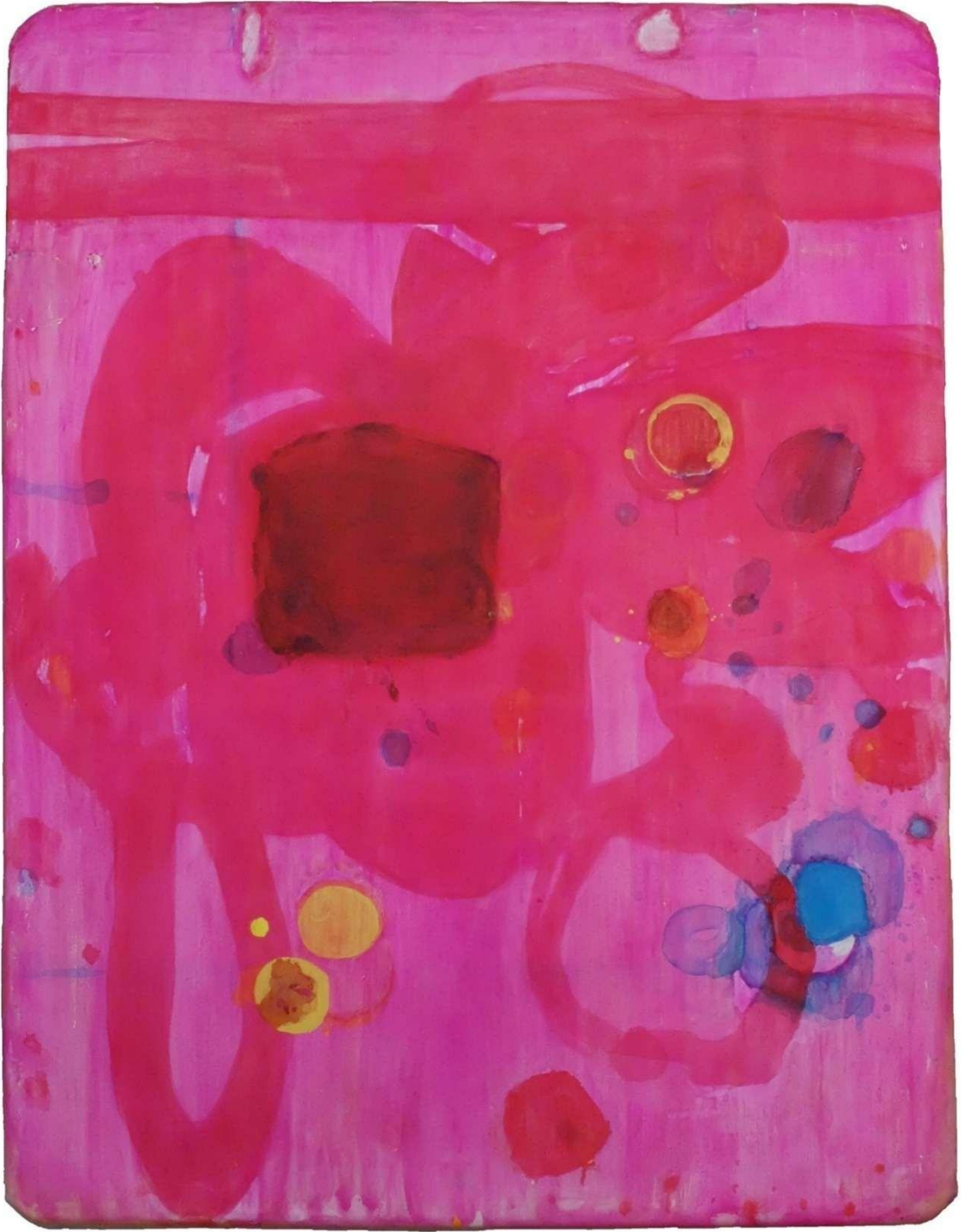
2018 Hanakana アクリル、キャンバス 165.5cmx125.5cm