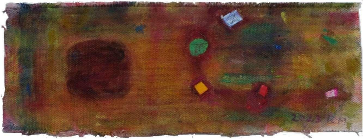
2023 Yume no Shikisaihen (夢の色彩片) 10 cm x26.2 cm アクリル、キャンバス 個人蔵