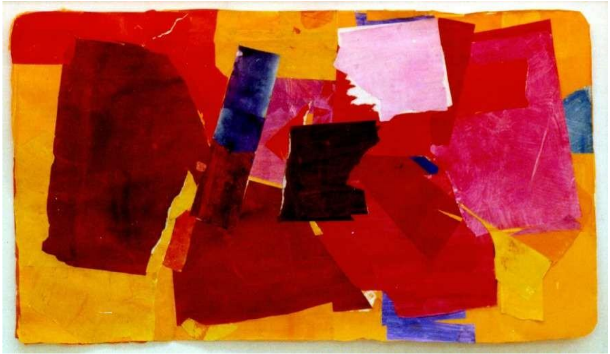
1987 Broken Book (壊れた本) 75cm x135.7cm アクリル・紙